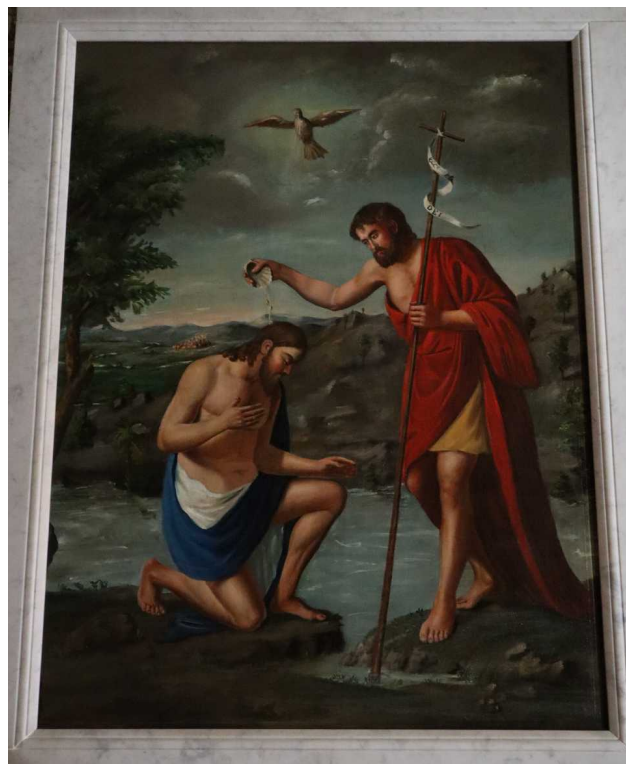
Marvejols, Collégiale Notre-Dame de la Carce, huile sur toile anonyme réalisée pour un autel-retable en 1852 pour accueillir les fonts baptismaux.

Telle est la joie du Père : nous voir porter du fruit en abondance.