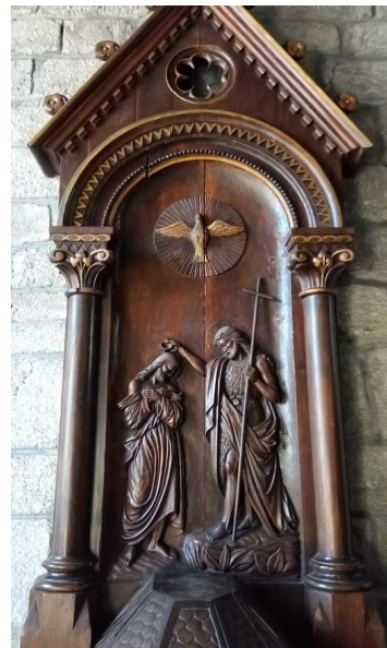
Église de Nasbinals