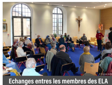
Echanges entre les membres des ELA