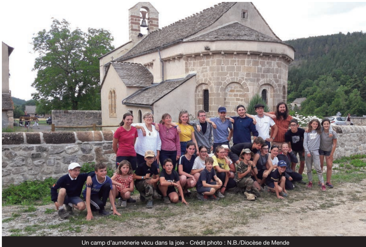
Un camp d'aumônerie vécu dans la joie