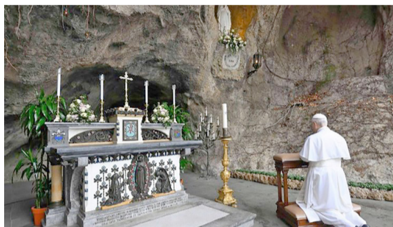
Le pape Léon XIV en France. Des Lozériens partiront à sa rencontre à Lourdes.

Depuis le début de son pontificat, Léon XIV rappelle que l'Église ne peut vivre repliée sur elle-même. Elle est appelée à rejoindre les femmes et les hommes de ce temps, à porter une parole de paix, à prendre soin des plus fragiles et à demeurer proche de ceux qui cherchent un sens, une présence ou une consolation. Sa venue en France sera donc accueillie comme un encouragement pour les communautés chrétiennes, mais aussi comme une parole adressée plus largement à notre société. Dans un monde