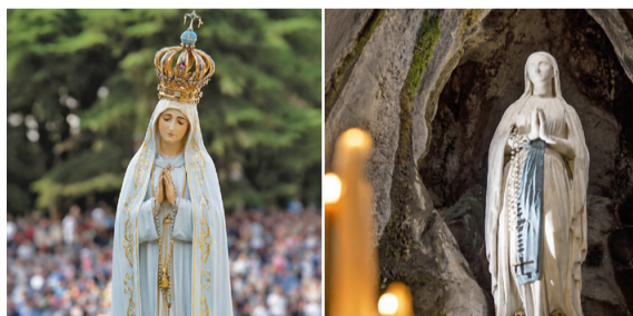
Lourdes, Fatima... Trois pèlerinages pour vivre une année de foi et d'espérance.

Le premier pèlerinage aura lieu du 7 au 9 décembre, à l'occasion de la fête de l'Immaculée Conception. Chaque année, cette célébration rassemble des milliers de fidèles venus honorer la Vierge Marie dans le sanctuaire où elle s'est présentée à Bernadette Soubirous en déclarant: « Je suis l'Immaculée Conception ». Vivre cette fête à Lourdes, c'est participer aux célébrations, aux processions et aux