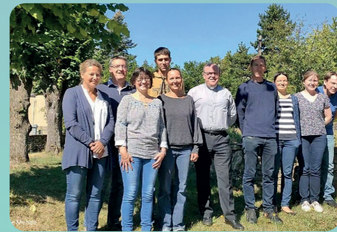
Equipe diocésaine de la pastorale familiale

L'équipe constituée a pour mission de promouvoir le sacrement de mariage et la beauté de cette vocation ; de former les membres des équipes de préparation au mariage, de proposer de l'accompagnement aux couples et aux familles ; de mettre en place des propositions d'aide et d'écoute pour les couples ou familles qui traversent des difficultés, et d'encourager les mouvements de spiritualité conjugale et d'éducation.