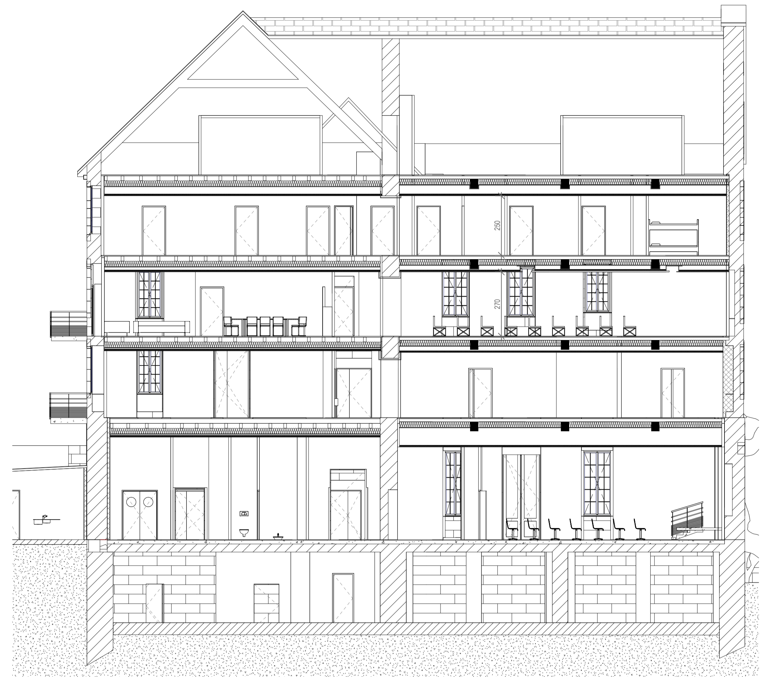
Coupe 3 Echelle: 1 : 100