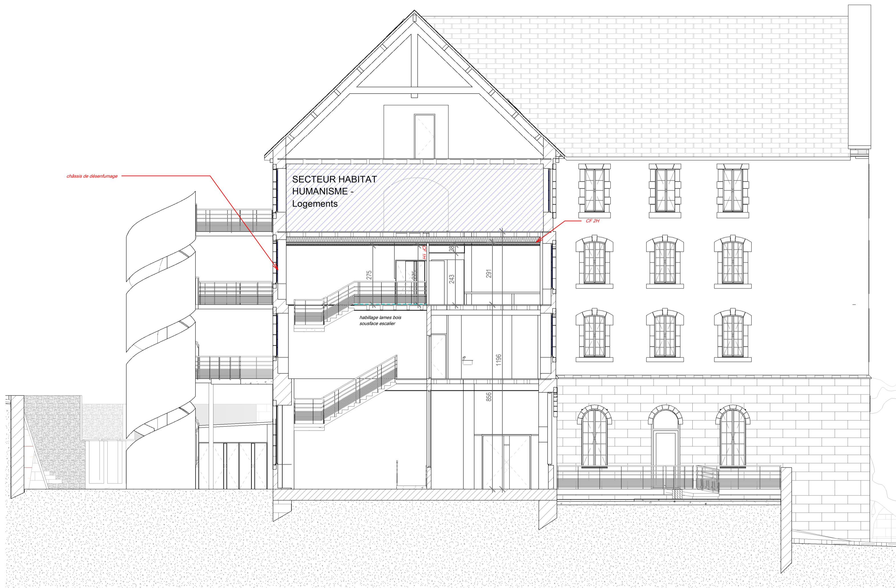
Coupe 1 Echelle: 1 : 100